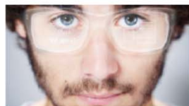
Siehe: Da die Möglichkeit! Der OÖ HightechFonds finanziert und unterstützt innovative Projekte.

Wenn innovative Ideen auf Geld und Mut treffen, können daraus großartige Erfolgsgeschichten werden – so wie beim OÖ HightechFonds. Der Venture Capital Fonds unterstützt heimische Start-ups und technologieorientierte KMU bei der Umsetzung von außergewöhnlichen Innovationen.