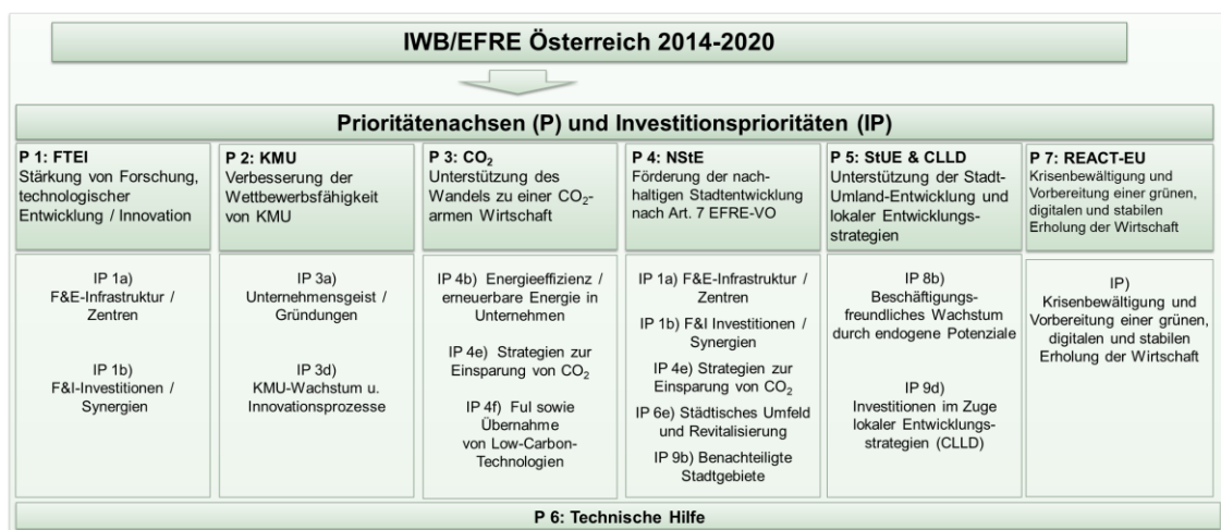
Abbildung „Struktur des österreichischen IWB/EFRE-Programms“: